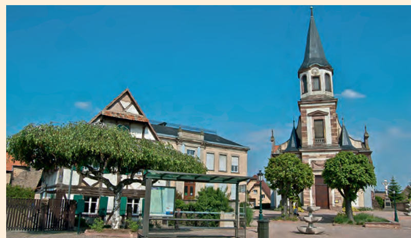
Église de Reichstett

Vivante et conviviale, Reichstett propose également des festivals musicaux et des animations tout au long de l'année.