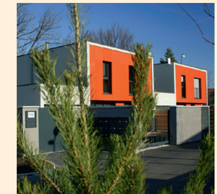
Ensemble de maisons « Les jardins Sambat », rue Sambat

3 e RÉALISATION DE SPIRIT À SAINT-ÉTIENNE