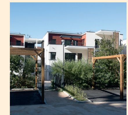
Logements collectifs « Résidence Desjoyaux », rue et impasse Desjoyaux