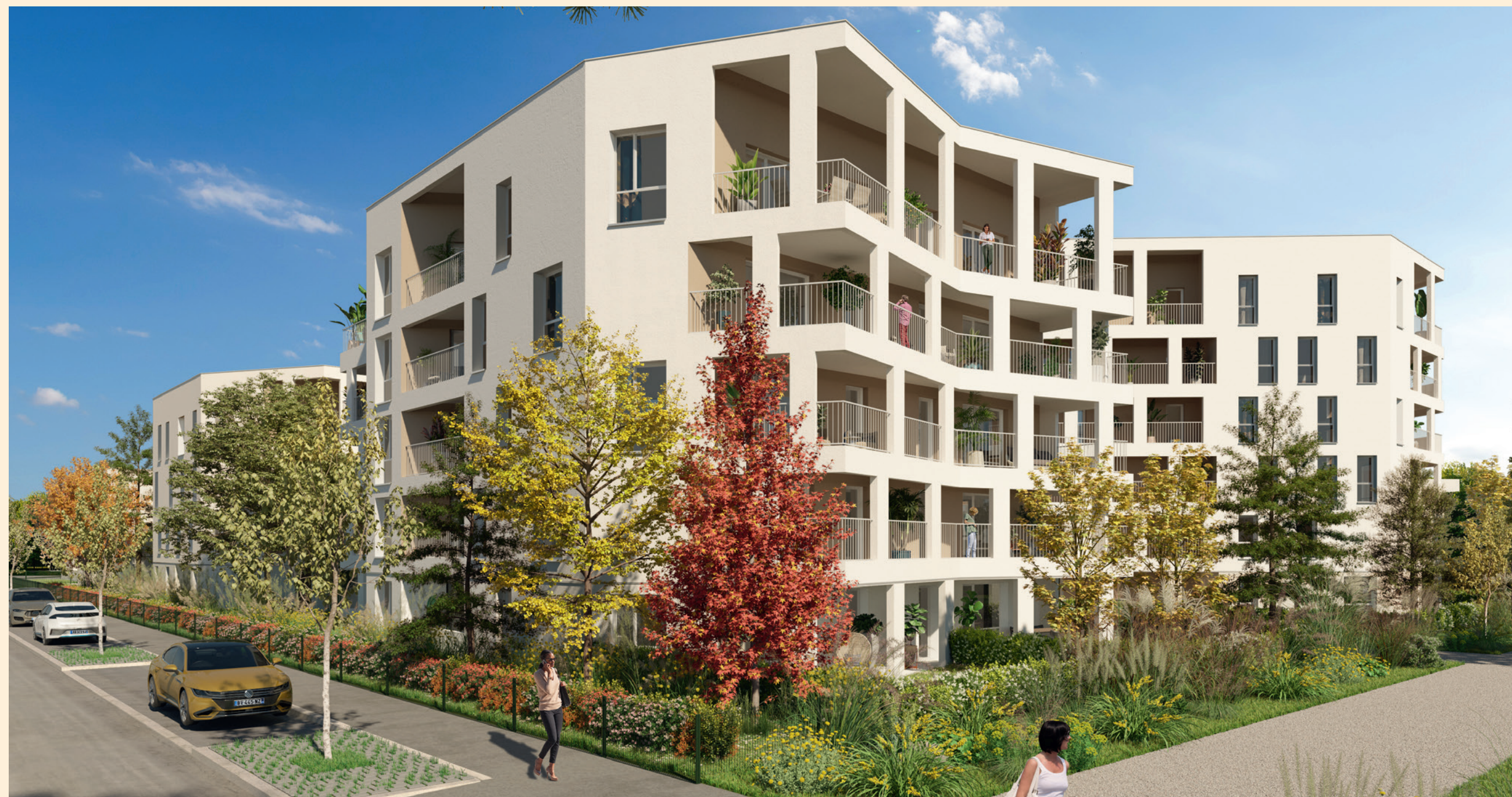
Vue depuis le boulevard du Colonel Marey