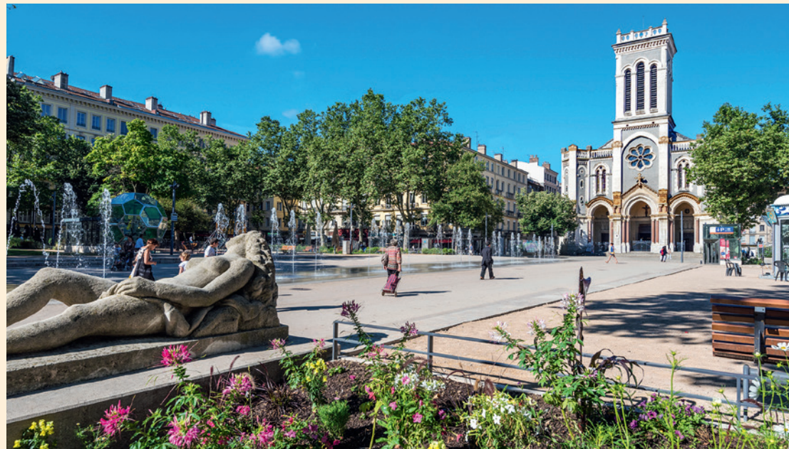
Vue depuis la place centrale

Sans rien renier de son passé, elle renforce désormais son excellence en misant sur le design, dont elle est la capitale mondiale. Seule ville de France à avoir été désignée Ville créative pour le design par l'Unesco, elle accueille en effet la biennale internationale du Design depuis 1998.