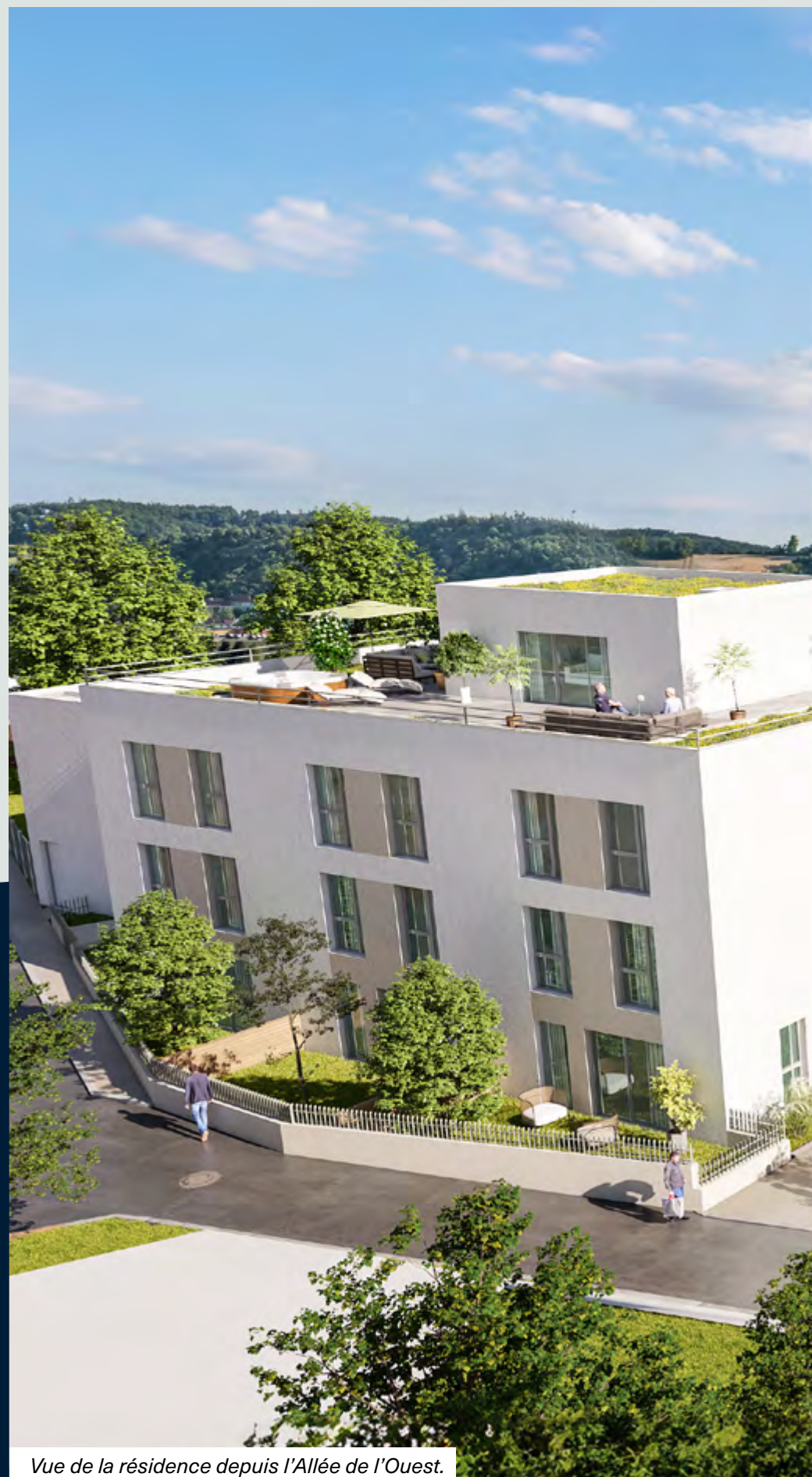
Vue de la résidence depuis l'Allée de l'Ouest.

Pierre-Yves CUSIN – l'Atelier 127 ARCHITECTES