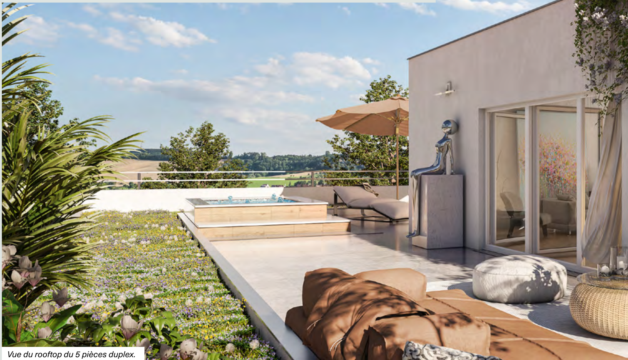
Vue du rooftop du 5 pièces duplex.