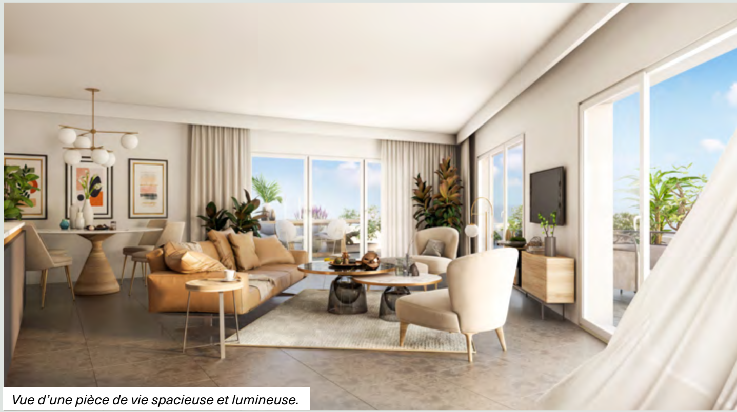
Vue d'une pièce de vie spacieuse et lumineuse.