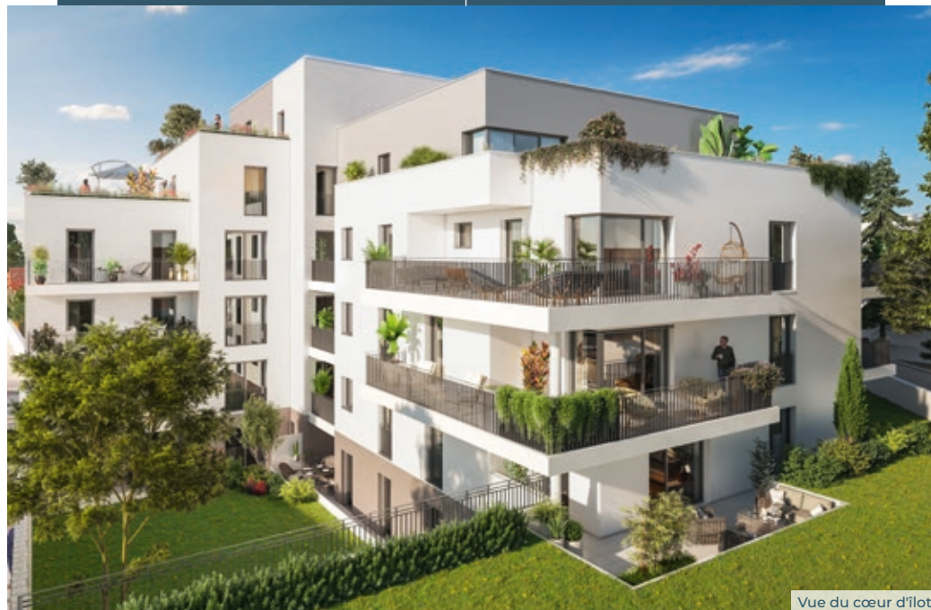
Vue du cœur d'îlot