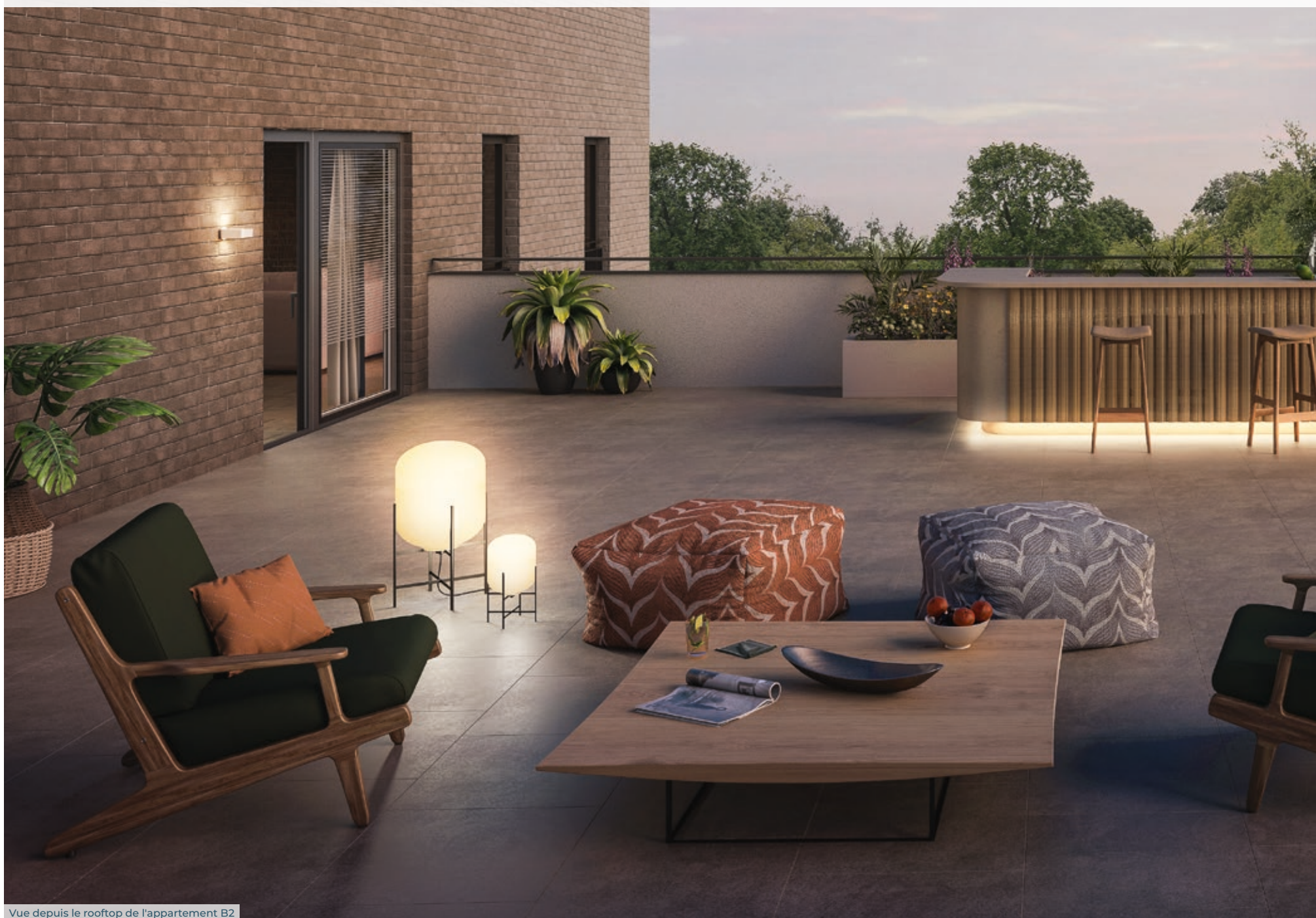
Vue depuis le rooftop de l'appartement B2

La plupart des séjours sont ouverts sur de très beaux espaces extérieurs, conçus comme de véritables pièces à vivre où il fait bon de se retrouver en famille ou entre amis, jardiner ou tout simplement profiter des premiers rayons du soleil. Grandes terrasses couvertes ou plein-ciel, rooftop d'exception et jardins privatifs en rez-de-chaussée inventent un nouvel art de vivre en cœur de ville.