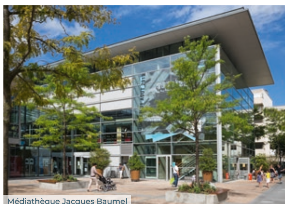
Médiathèque Jacques Baumelet