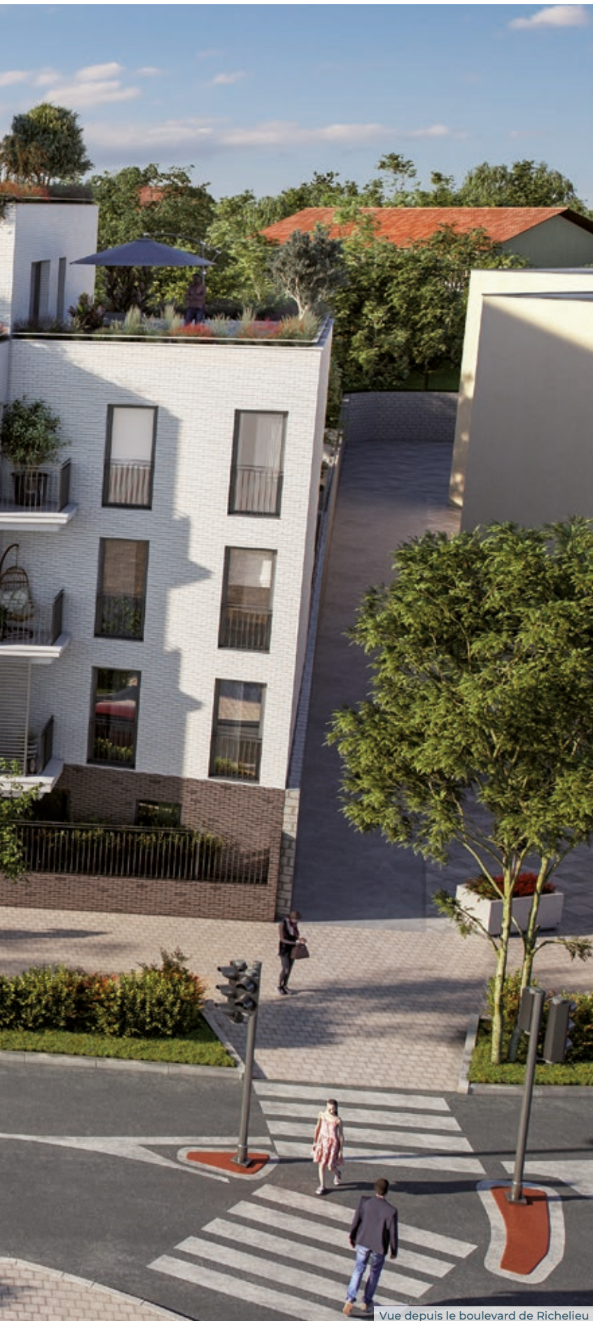
Vue depuis le boulevard de Richelieu