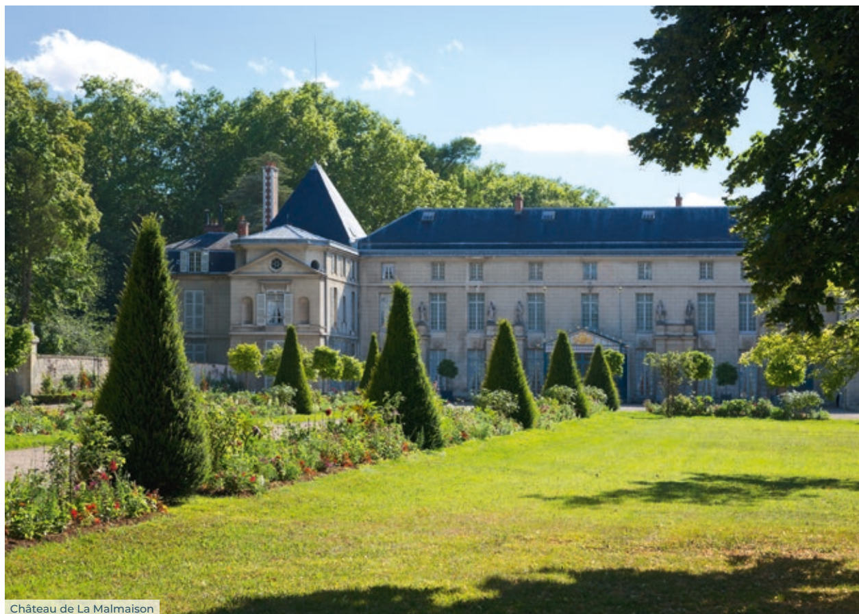
Château de La Malmaison

Au quotidien les Rueillois profitent d'une offre scolaire complète, de la maternelle au lycée, d'un centre-ville authentique qui abrite des monuments classés, de nombreux commerces, de trois marchés de produits frais, de tous les services nécessaires et d'une offre culturelle et sportive exigeante.