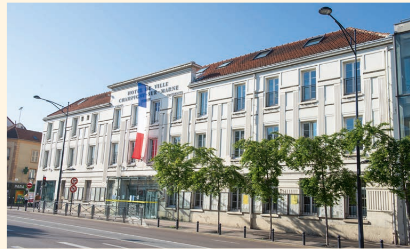
Mairie de Champigny-sur-Marne

À proximité des grands pôles d'activité, Champigny-sur-Marne démontre par son dynamisme et sa modernité qu'elle a su mettre en valeur ses nombreux atouts. Facilement accessible par les transports en commun et les grands axes routiers, la ville offre un quotidien en tout point pratique.