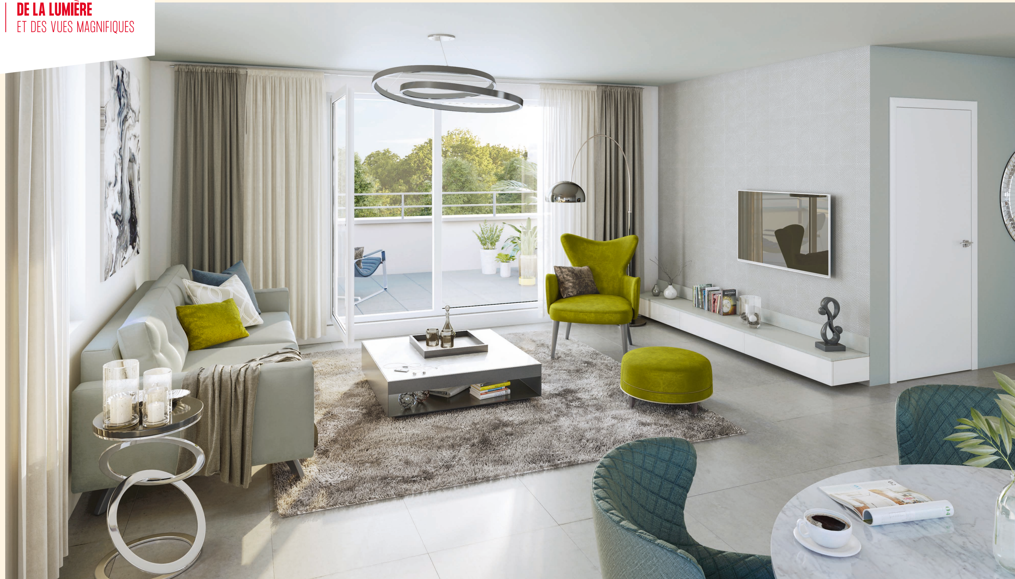
Vue depuis un appartement de la résidence "Elegancia"

La conception de la résidence, la diversité de ses volumes et de ses ouvertures favorisent la grande luminosité des intérieurs. Dans ces intérieurs inondés de lumière, du 2 au 5 pièces, l'atmosphère de bien-être paisible se trouve renforcée par les belles dimensions des espaces et leurs finitions soignées.