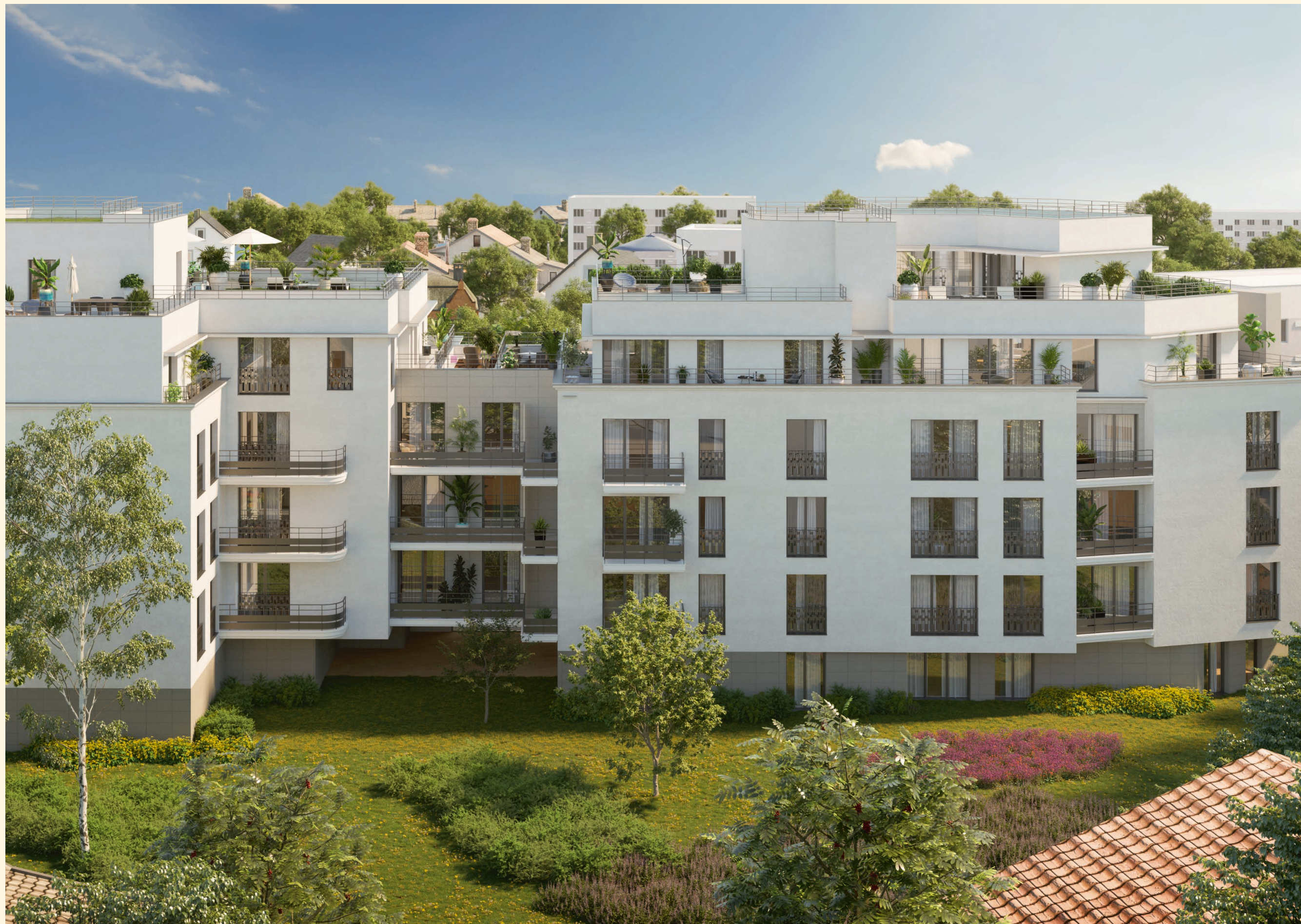
Vue depuis le cœur d'îlot