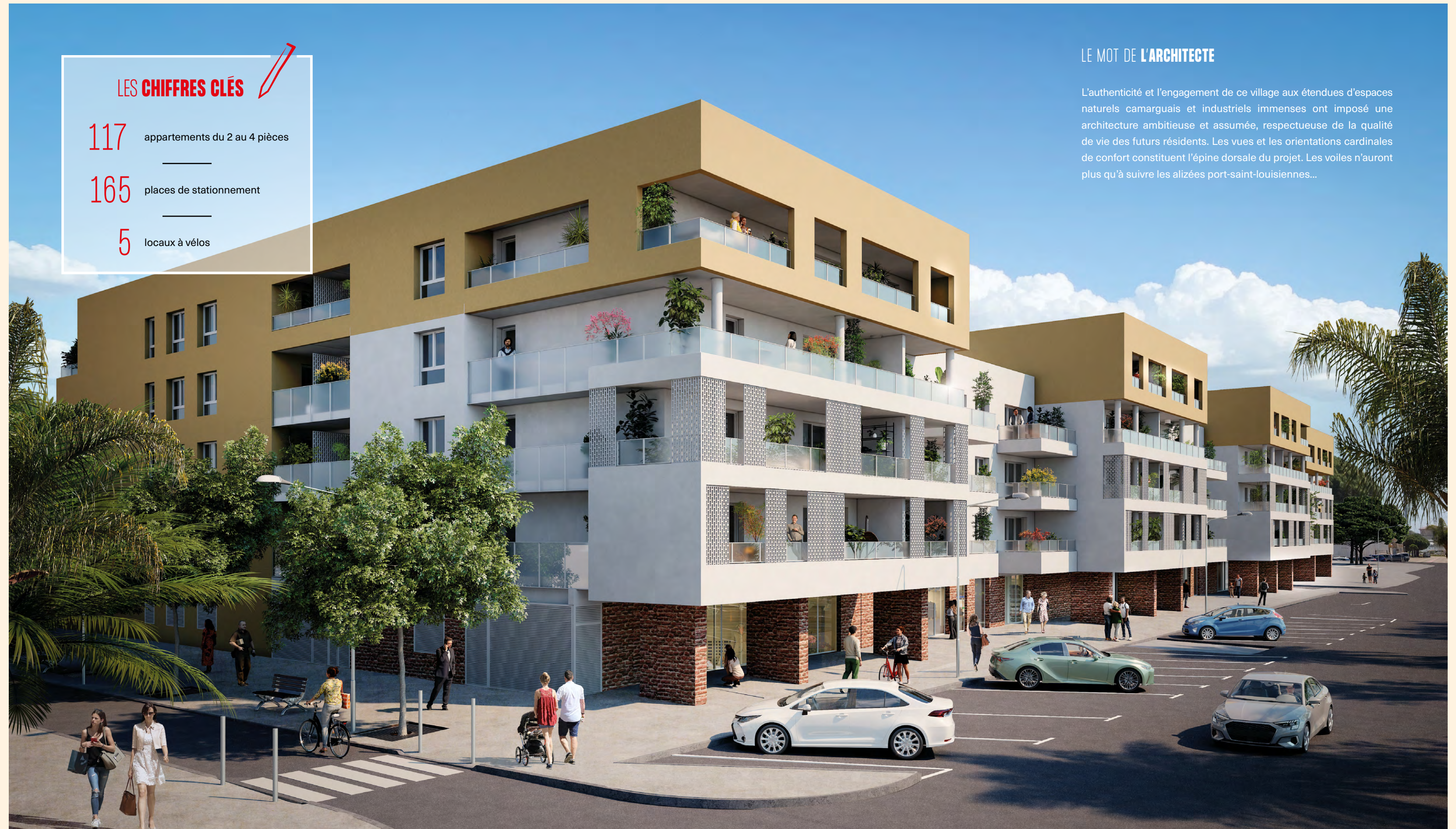
Vue depuis la rue Crémieux