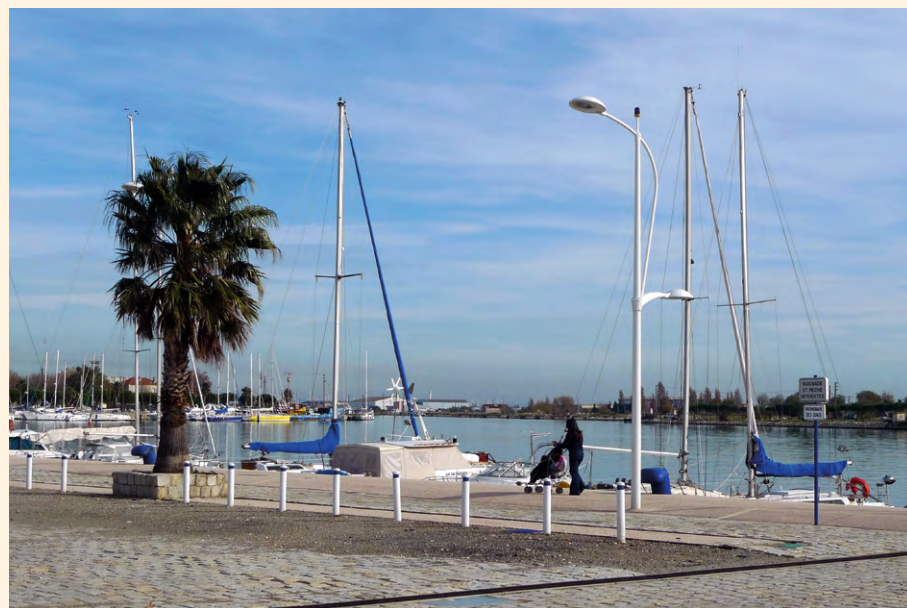
Vue du port de plaisance

En connexion directe avec les réseaux de transports, la commune se trouve au cœur d'un triangle dynamique formé par les villes d'Aix-Marseille, Montpellier et Avignon, non loin du bassin d'emploi attractif du pourtour de l'Étang de Berre et du pays d'Arles.